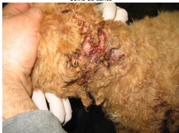
Soins de santé