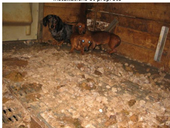
Installations et propreté